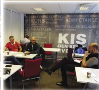
Engasjerte avdelingsledere og serviceledere på Lederkurs i Asker.

KIS Skolen har i høst holdt to dagers Lederkurs for nesten 40 ledere i september og oktober. Kurset er første trinn i en tredelt lederopplæring.