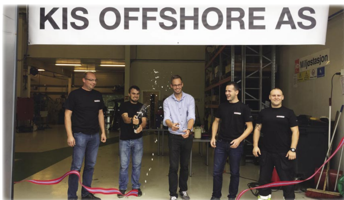
Eableringen av KIS OFFSHORE AS ble markert med båndklipping i Bergen.

KIS gruppen benytter «tøffe tider» til å etablere et firma for tjenester til offshorenæringen. Etter flere år som avdeling i KIS VEST AS ble KIS OFFSHORE AS etablert som eget selskap 1. september 2015.