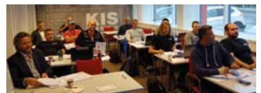
UPK kurs 22. september 2015.

Noe av det flotteste med KIS Skolen er at den har blitt et samlingspunkt for alle ansatte fra 21 avdelinger i hele Norge. Vi arrangerer felles middag og kveldsaktiviteter ved alle kurs. Dette skaper en unik intern relasjonsbygging i KIS.