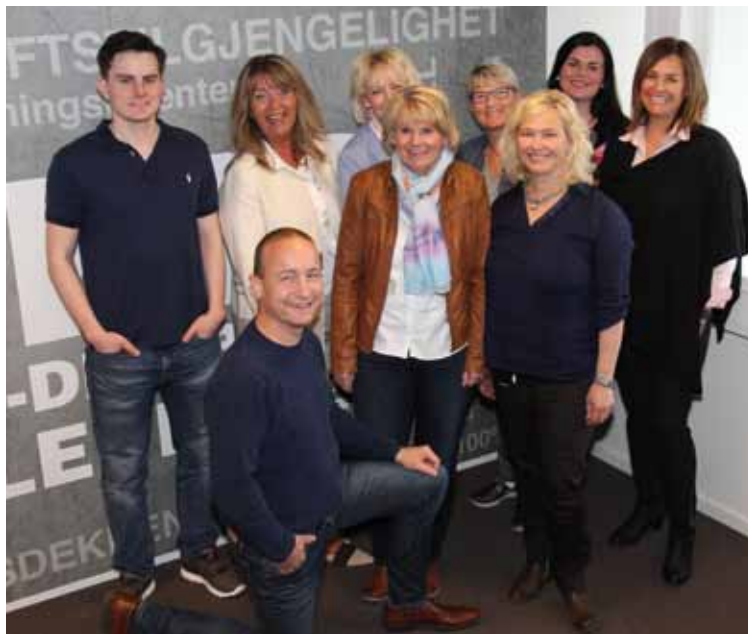
Til venstre: Vismakurs 2-3. mai 2016. Til høyre: Lederkurs 10-11. mai 2016.

I 2016 ble det gjennomført en kapitalutvidelse i KIS PARTNERS AS, da man ønsket å få inn flere ansatte på eiersiden. Dette ble positivt mottatt og vi fikk mange nye aksjonærer. Totalt er det nå 57 aksjonærer i KIS PARTNERS AS. Aksjonærene er hovedsakelig daglig ledere og øvrige ansatte i KIS gruppen, noe som er positivt for videre utvikling.