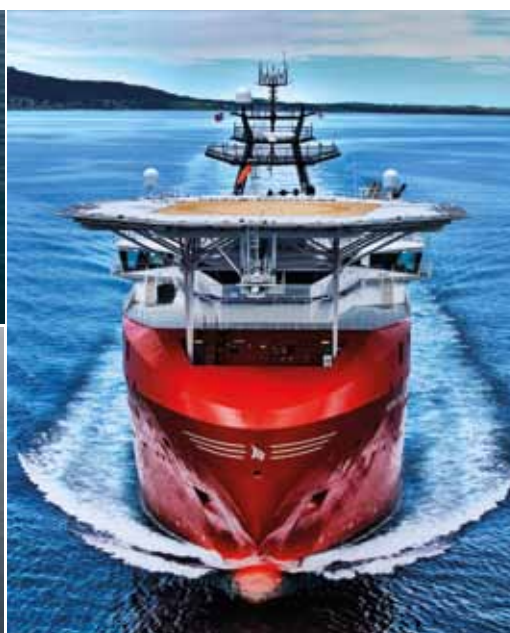
Siem Offshores flåte består av 3 forskj. typer skip; MRSV (konstruksjonsfartøy m/store offshorekraner), AHTS (ankerhåndteringsfartøy som flytter borerigg) og PSV (supportskip som frakter varer, utstyr og containere til riggene).

KIS MARITIME AS har inngått en KIS Avtale med Siem Offshore Inc. Det store norske rederiet som startet i 2005 som utspring av Subsea 7, har i dag 45 skip som betjener olje- og gassindustrien world wide.