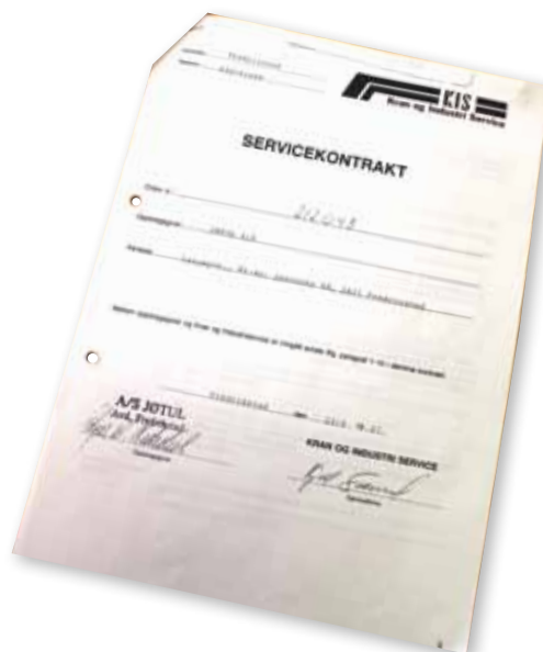
Den aller første servicekontrakten med Jøtul fra 1987.