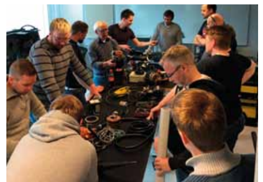
G4 kontrollørkurs 25-29. april 2016.