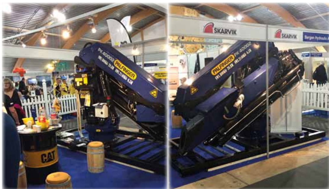
Palfinger kranene fra BERGEN HYDRAULIC AS var godt synlige på fiskerimessen. Bildet er fra Skarvik AS sin stand.