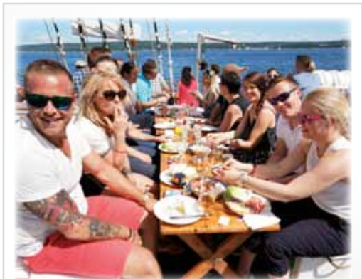
Fra Oscarsborg gikk veien videre i fire skuter og KIS ansatte fikk sett Oslofjorden fra sin aller beste side mens de koste seg med mat og drikke om bord.