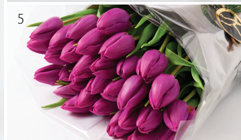
1. To-grenet, hvit orkidé i hvit, glassert potte - kr 345,- pr. stk 2. Førjulshilsen - stor, flott bukett med lilla tulipaner - kr 475,- 3. Trendy, grønn Cymbidium i glassvase - kr 590,- 4. Snevit - enkelt dekorert, hvit, Amaryllis i kobberfarget potte - kr 275,- 5. Lilla tulipaner, gavepakket - fra kr 175,- (lilla tulipaner selges kun i perioden 15. - 27. nov)