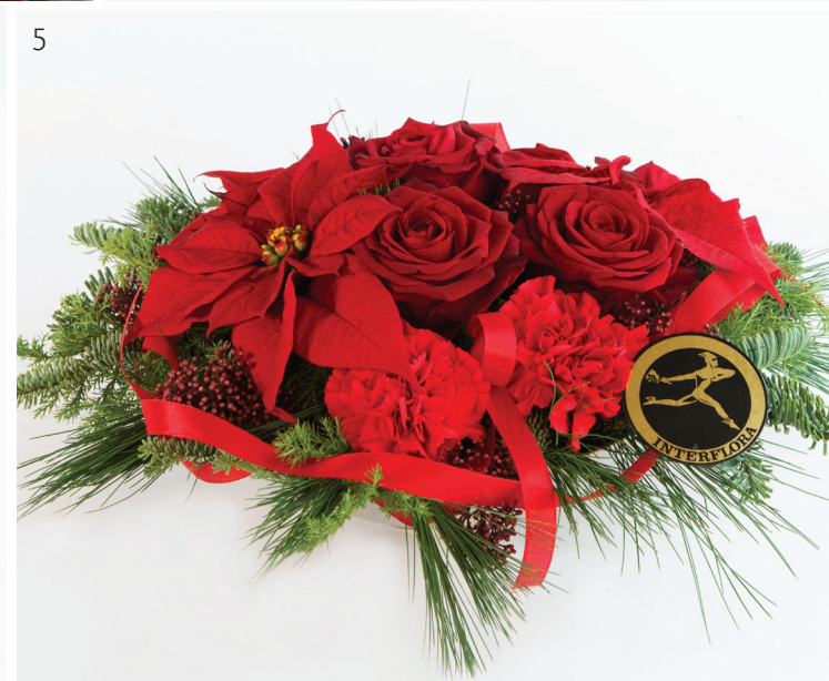
1. Julestemning - Stor bukett røde tulipaner og julegrønt - kr 475,- 2. Orkidéfantasi - stor dekorasjon med julens blomster og tilbehør - kr 470,- 3. Røde tulipaner i glassvase - kr 375,- 4. Julemorgen - høy bukett med røde Amaryllis - kr 200,- 5. Gledelig jul - stor, rød dekorasjon - kr 570,-