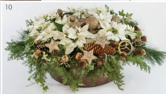
7. Multiflora svibel - herlig sammenplantning med svibel og julens tilbehør - kr 400,- 8. Stor, hvit julekurv, - kr 595,- 9. Hvit Azalea i kobberfarget potte - kr 250,- 10. Ekstra stor, hvit julegrøte - kr 1 250,- 11. Snevit - enkelt dekorert, hvit Amaryllis i hvit, høy potte - kr 275,- pr stk.