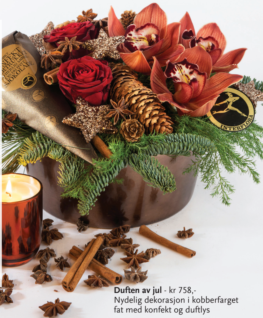
Duften av jul - kr 758,- Nydelig dekorasjon i kobberfarget fat med konfekt og duftlys

Vis ekstra omtanke til jul med blomster, sjokolade, cider og deilig duft.